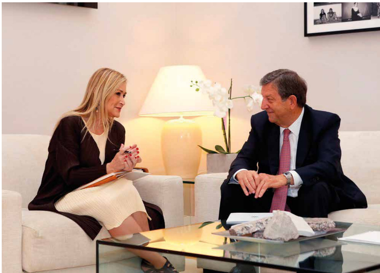
Reunión del alcalde con la presidenta Cristina Cifuentes